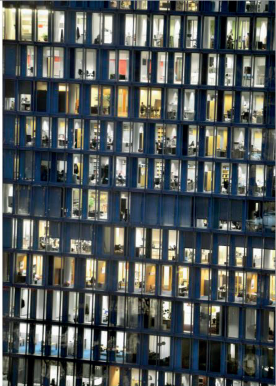
L'Espresso (Spain, Rome)