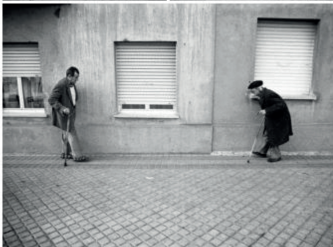
Corbis (Spain, Rome) | Corbis (Spain, Rome) L'Espresso (Spain, Rome)